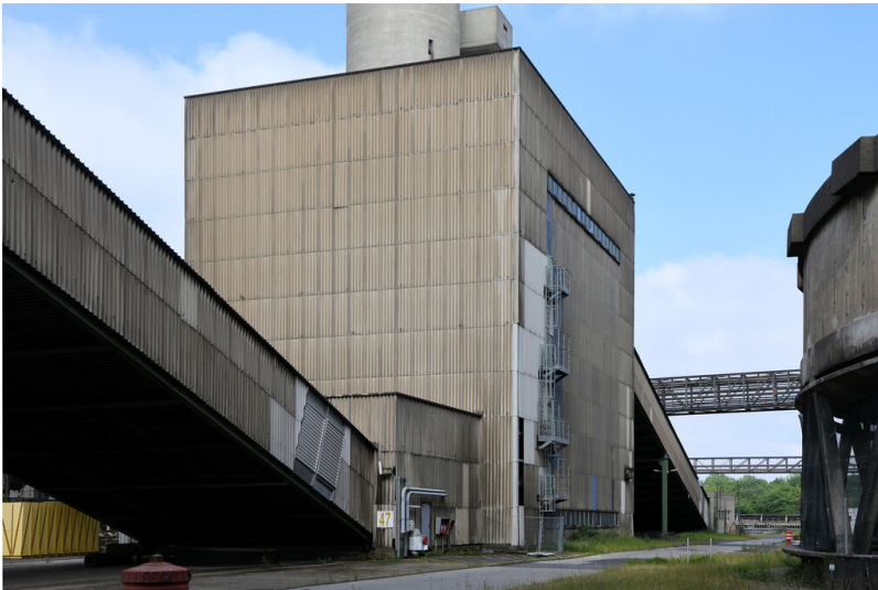
Kraftwerk Frimmersdorf II: Brecherei 3, Ansicht von Osten; Foto: 23.06.2023