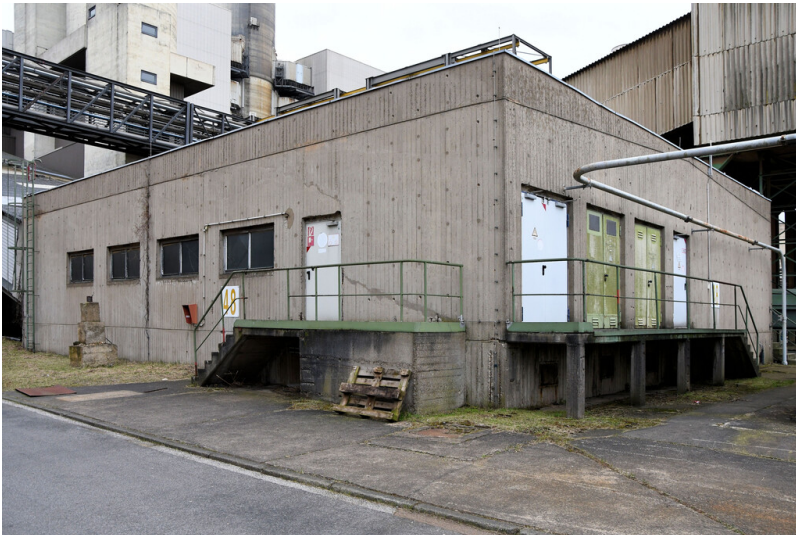
Kraftwerk Frimmersdorf II: Eisenausscheidung 3, Ansicht von Nordwesten; Foto: 22.03.2023