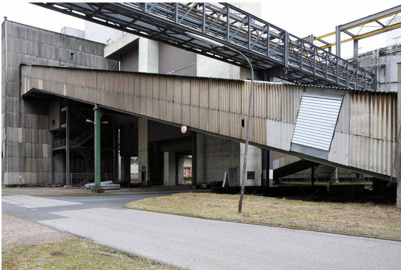
Kraftwerk Frimmersdorf II: Bandbrücke von der Eisenausscheidung 3 zur Brecherei 3, Ansicht von Nordwesten