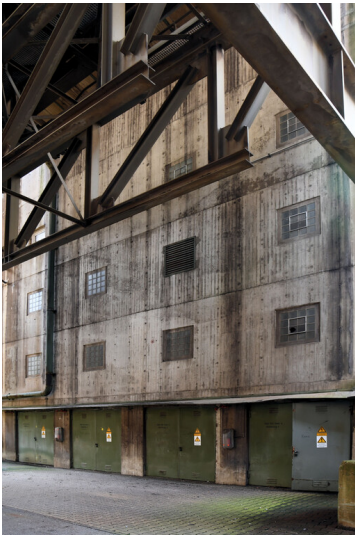
Kraftwerk Frimmersdorf II: Bekohlungssecturm 2, Schaltanlage, Ansicht von Osten; Foto: 21.03.2023