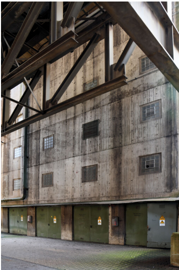
Kraftwerk Frimmersdorf II: Bekohlungsseckturm 2, Schaltanlage, Ansicht von Osten; Foto: 21.03.2023