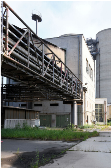
Kraftwerk Frimmersdorf II: Brecherei 2, Ansicht von Süden; Foto: 23.06.2023