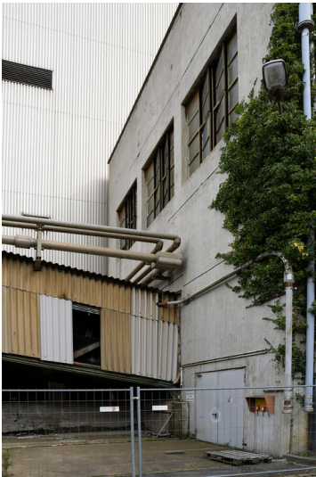
Kraftwerk Frimmersdorf II: Bekohlungsleckturm 1 mit Ausgang der Bandbrücke zum Verteilgebäude, Ansicht von Südwesten; Foto: 22.03.2023