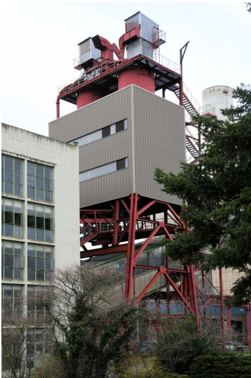
Kraftwerk Frimmersdorf II: TAV-Anlage im Bekohlungsweg Grabenbunker 1 - Schwerbau Block A, Ansicht von Südosten; Foto: 22.03.2023