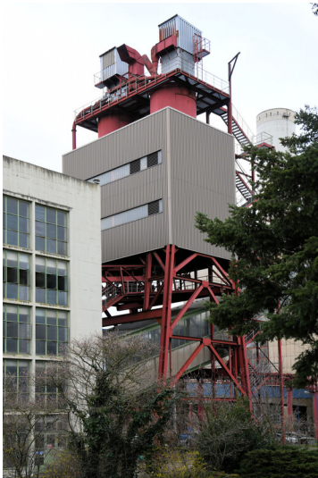
Kraftwerk Frimmersdorf II: TAV-Anlage im Bekohlungsweg Grabenbunker 1 - Schwerbau Block A, Ansicht von Südosten; Foto: 22.03.2023