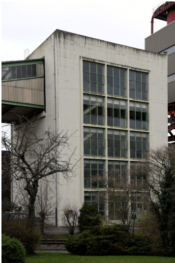
Kraftwerk Frimmersdorf II: Brecherei 1, Ansicht von Südosten; Foto: 22.03.2023