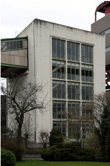
Kraftwerk Frimmersdorf II: Brecherei 1, Ansicht von Südosten