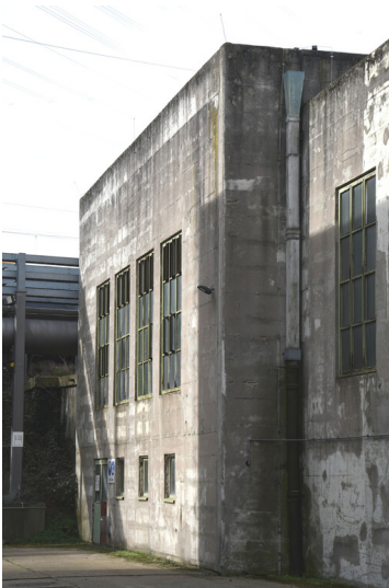
Kraftwerk Frimmersdorf II: Eisenausscheidung 1, Ansicht von Nordosten