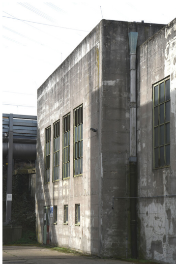
Kraftwerk Frimmersdorf II: Eisenausscheidung 1, Ansicht von Nordosten; Foto: 22.03.2023