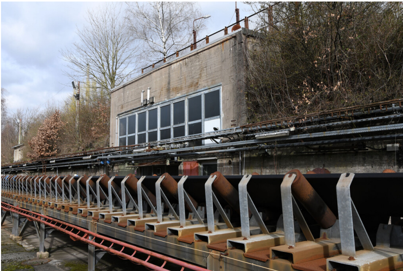
Kraftwerk Frimmersdorf II: Grabenbunker 1, Tunneleingangsbauwerk für den Bandtunnel zur Eisenausscheidung 1, Ansicht von Süden; Foto: 22.03.2023