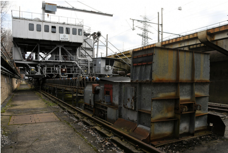
Kraftwerk Frimmersdorf II: Bunkerbagger 4 im Grabenbunker 1, Ansicht von Westen; Foto: 22.03.2023