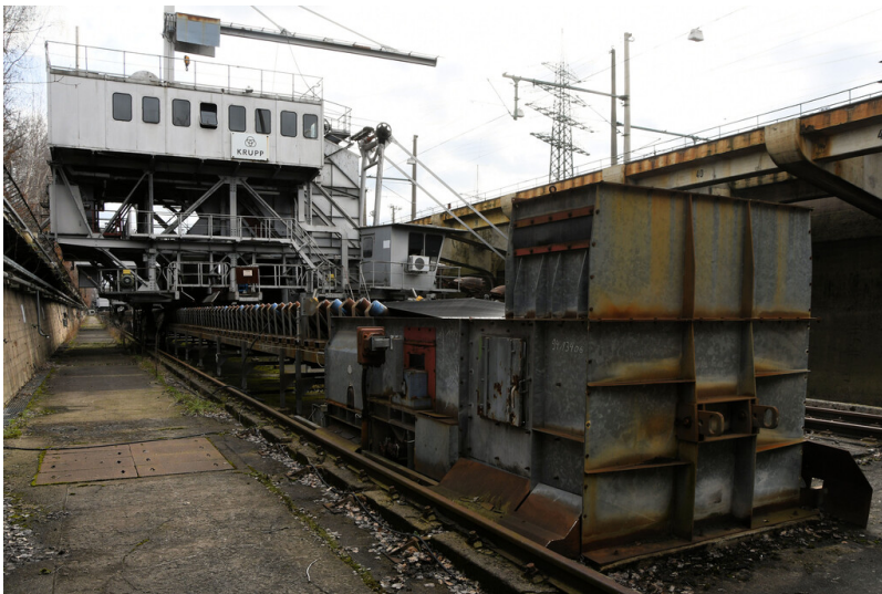
Kraftwerk Frimmersdorf II: Bunkerbagger 4 im Grabenbunker 1, Ansicht von Westen; Foto: 22.03.2023