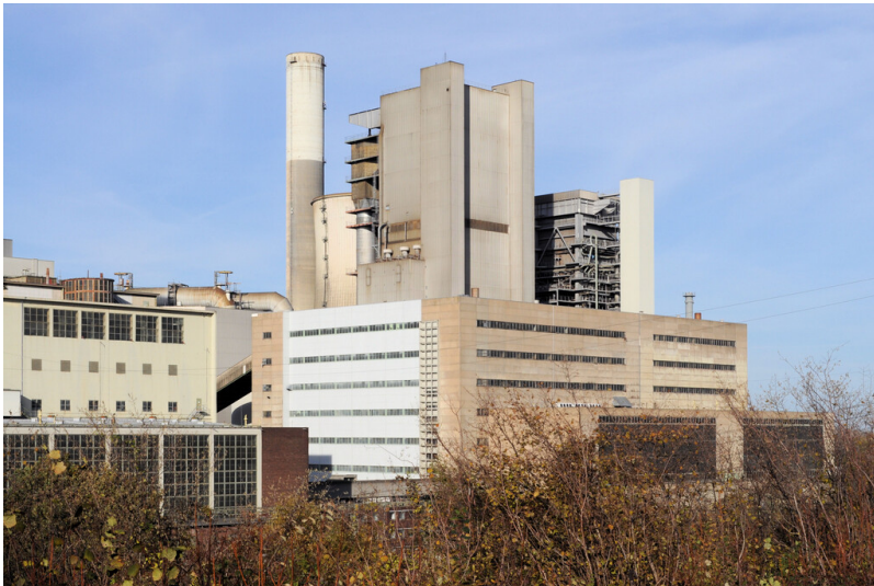
Kraftwerk Frimmersdorf II: Kesselhäuser Blöcke P und Q, Ansicht von Südosten; Foto: 13.11.2020