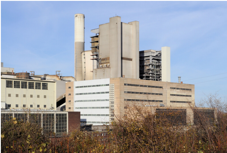
Kraftwerk Frimmersdorf II: Kesselhäuser Blöcke P und Q, Ansicht von Südosten; Foto: 13.11.2020