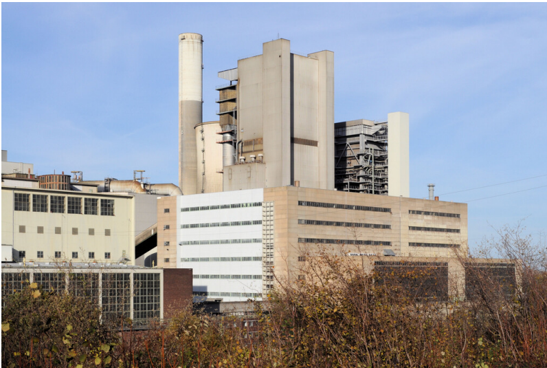
Kraftwerk Frimmersdorf II: Kesselhäuser Blöcke P und Q, Ansicht von Südosten