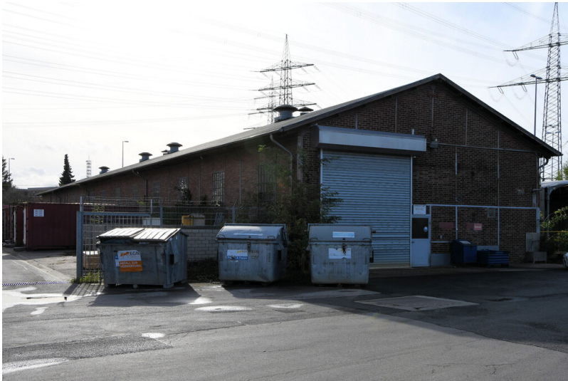
Tagebau Inden: Vorrichtungshalle, Ansicht von Nordosten; Foto: 09.11.2022