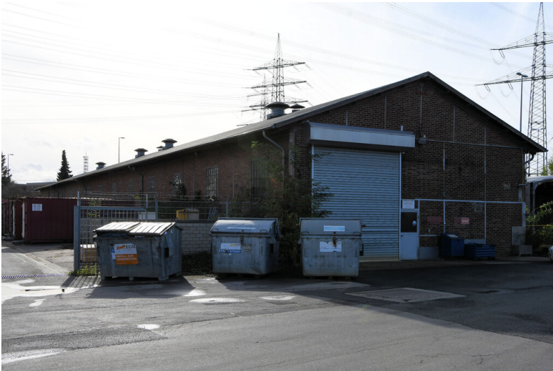
Tagebau Inden: Vorrichtungshalle, Ansicht von Nordosten; Foto: 09.11.2022