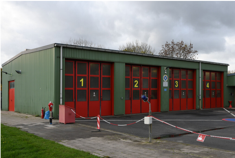
Tagebau Inden: Garage für Feuerwehrfahrzeuge, Ansicht von Osten; Foto: 09.11.2022