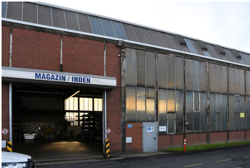
Tagebau Inden: Magazin / Lagerhalle, Eingang vom Lagerplatz aus, Ansicht von Norden; Foto: 09.11.2022