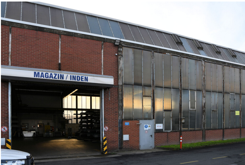
Tagebau Inden: Magazin / Lagerhalle, Eingang vom Lagerplatz aus, Ansicht von Norden