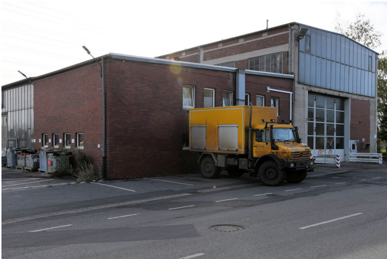
Tagebau Inden: Hilfsgeräte- und Kfz-Werkstatt, Ansicht von Nordosten; Foto: 09.11.2022