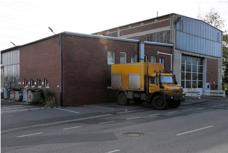
Tagebau Inden: Hilfsgeräte- und Kfz-Werkstatt, Ansicht von Nordosten; Foto: 09.11.2022