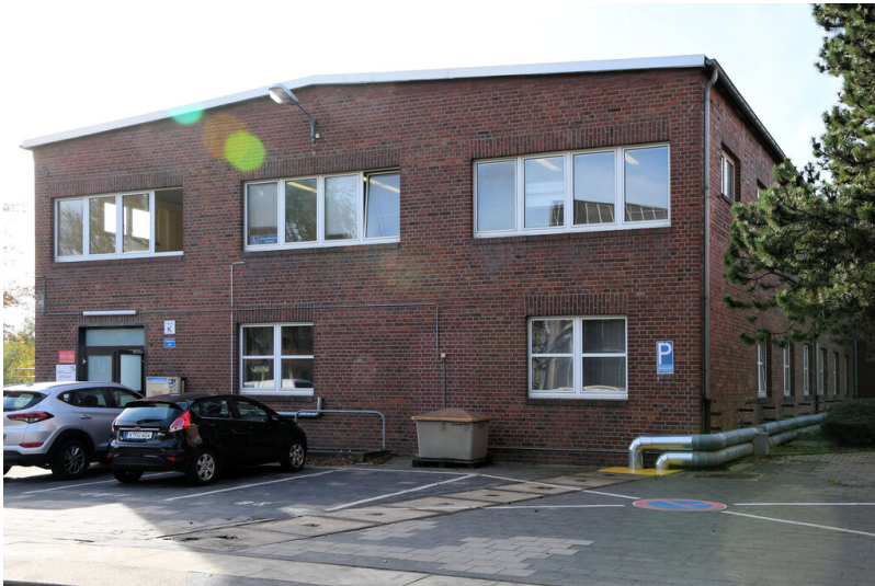
Tagebau Inden: Sozialgebäude Werkstattbereich (Haus K), Ansicht von Osten; Foto: 09.11.2022