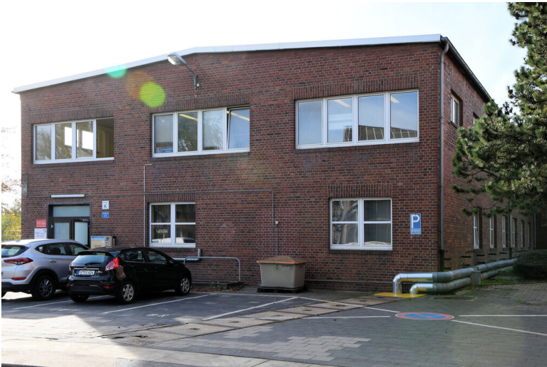
Tagebau Inden: Sozialgebäude Werkstattbereich (Haus K), Ansicht von Osten; Foto: 09.11.2022