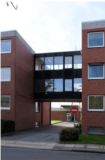
Tagebau Inden: Verbindungsbrücke zwischen Haus A und Haus B, Ansicht von Osten; Foto: 09.11.2022