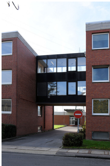
Tagebau Inden: Verbindungsbrücke zwischen Haus A und Haus B, Ansicht von Osten; Foto: 09.11.2022