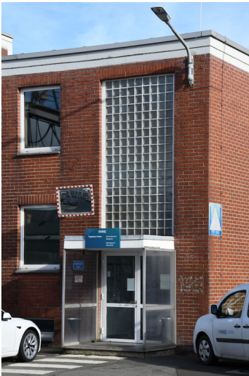
Tagebau Inden: Eingang und Treppenhaus Gebäude für Archiv und Betriebsrat, Ansicht von Westen; Foto: 09.11.2022