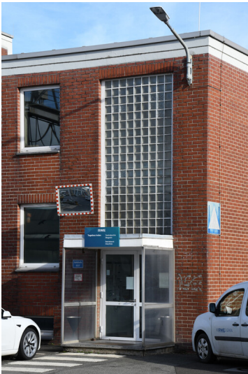
Tagebau Inden: Eingang und Treppenhaus Gebäude für Archiv und Betriebsrat, Ansicht von Westen; Foto: 09.11.2022