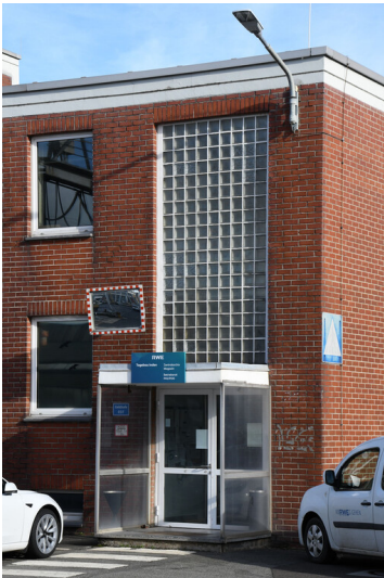
Tagebau Inden: Eingang und Treppenhaus Gebäude für Archiv und Betriebsrat, Ansicht von Westen