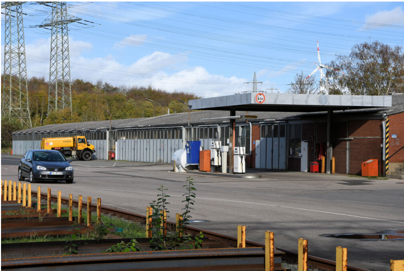
Tagebau Inden: Tankstelle, Pkw-Waschhalle, Garagen, Ansicht von Südwesten; Foto: 09.11.2022