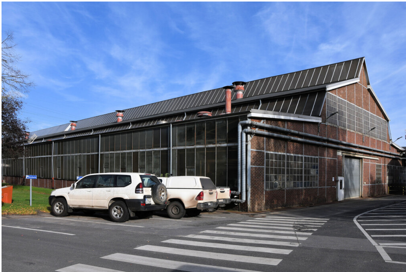
Tagebau Inden: Betriebswerkstatt (Haus W), Ansicht von Südwesten