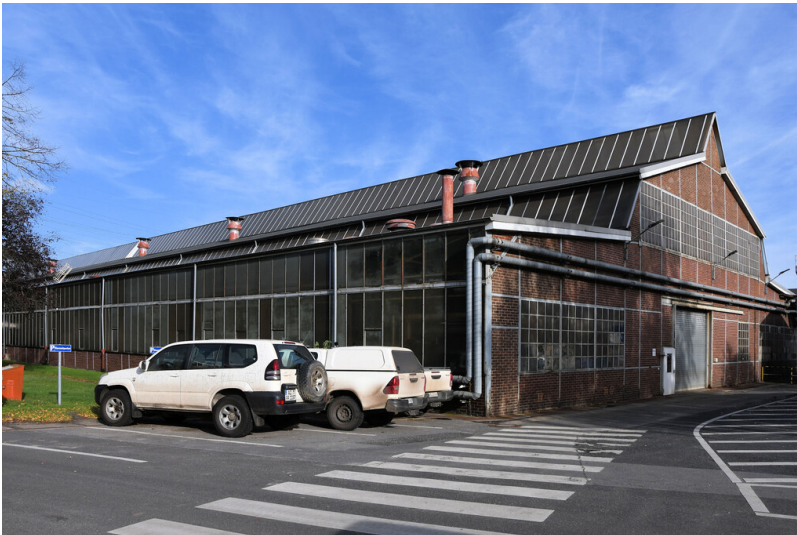
Tagebau Inden: Betriebswerkstatt (Haus W), Ansicht von Südwesten; Foto: 09.11.2022