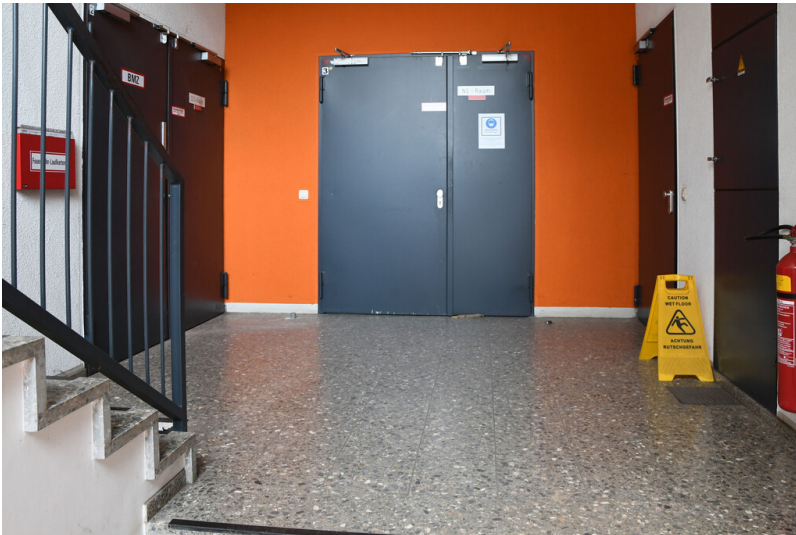
Tagebau Inden: Betriebsüberwachung, Eingangshalle, Ansicht von Südosten