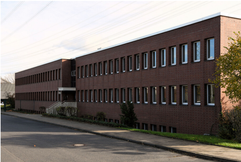
Tagebau Inden: Tagebauverwaltung, Ansicht von Westen