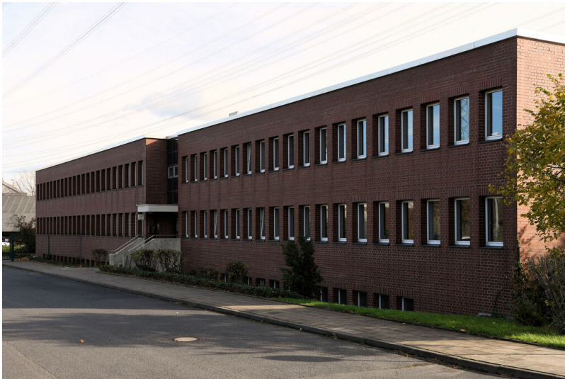
Tagebau Inden: Tagebauverwaltung, Ansicht von Westen; Foto: 09.11.2022