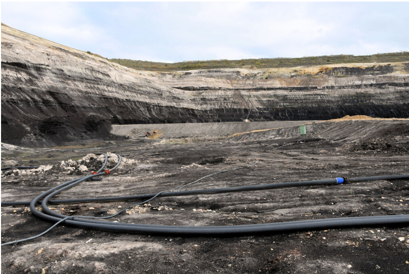
Tagebau Inden: fliegende Wasserhaltung auf der 4. Sohle, Überlaufbecken und HD-PE-Rohrleitungen