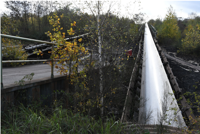
Tagebau Inden: zu Bandschleifenwagen 982 im Kohlebunker Inden führendes Förderband, Ansicht von Nordosten; Foto: 09.11.2022