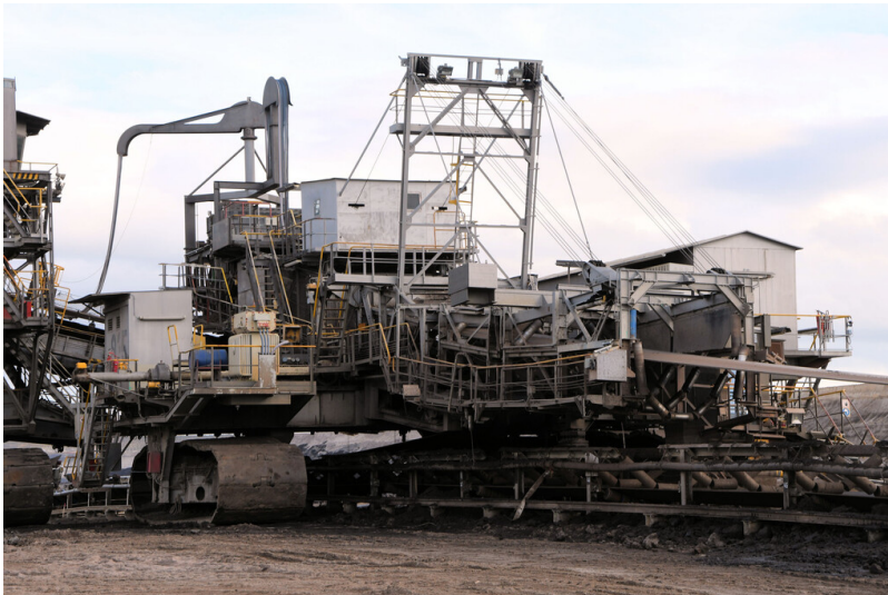
Tagebau Inden: Bandschleifenwagen 935, Auflaufteil