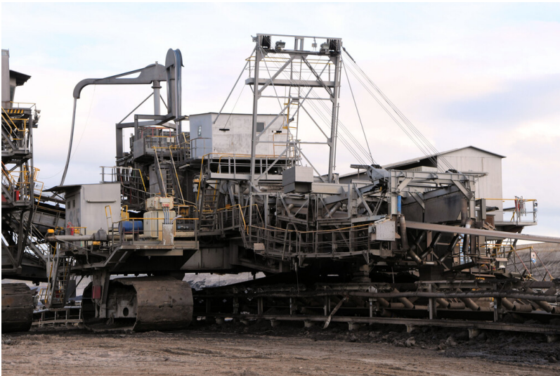
Tagebau Inden: Bandschleifenwagen 935, Auflaufteil; Foto: 09.11.2022