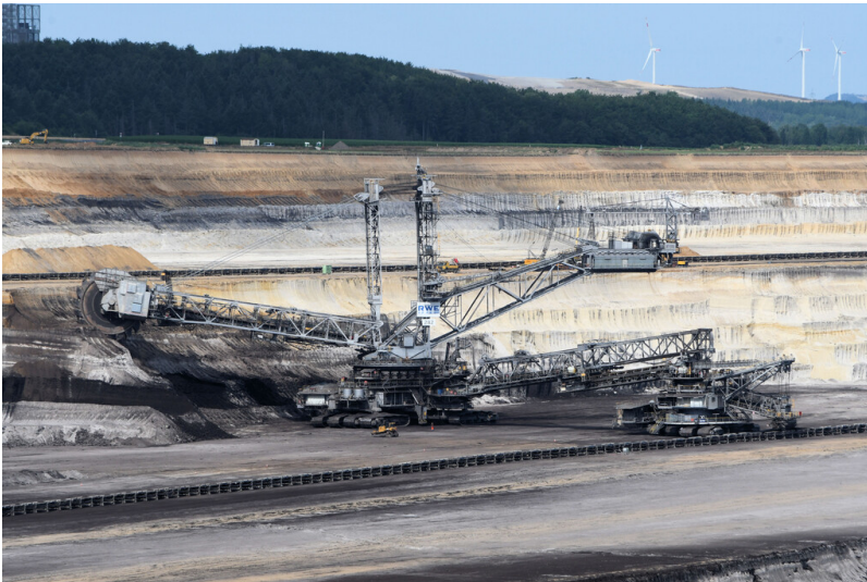
Tagebau Inden: Schaufelradbagger 282 bei der Abraumbewinnung, Ansicht von Nordosten (Tagebau-Aussichtspunkt Schophoven); Foto: 14.07.2023