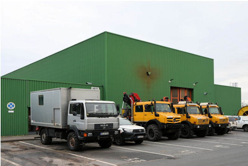
Tagebau Hambach: EA Stützpunkt (Bau HA 111), Ansicht von Nordwesten; Foto: 07.11.2022