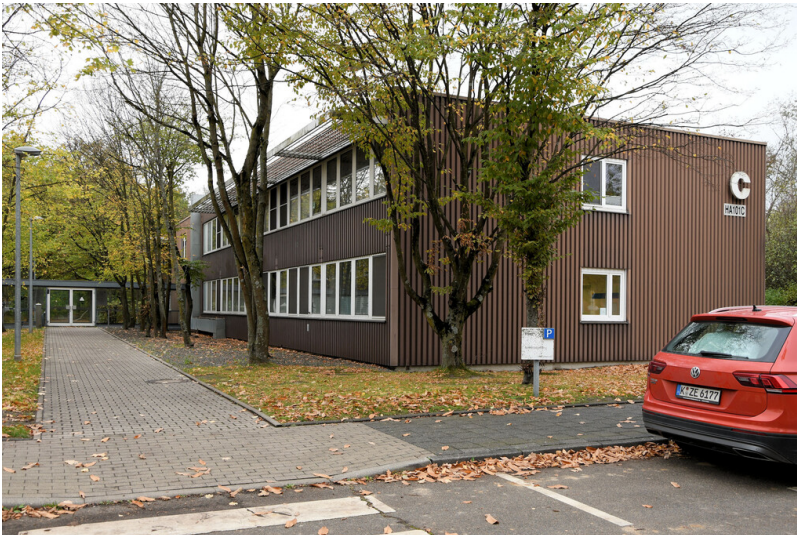
Tagebau Hambach: Tagebauverwaltung Haus C, Ansicht von Osten; Foto: 07.11.2022