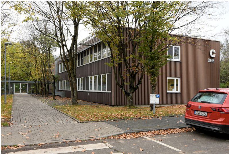
Tagebau Hambach: Tagebauverwaltung Haus C, Ansicht von Osten