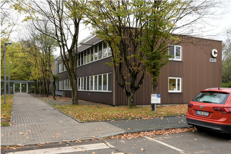
Tagebau Hambach: Tagebauverwaltung Haus C, Ansicht von Osten; Foto: 07.11.2022