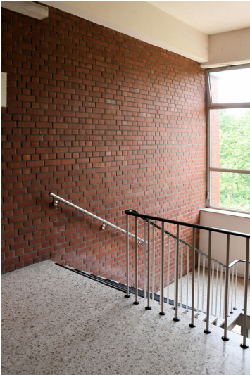
Tagebau Hambach: Betriebsüberwachungsstelle (Gebäude HA 121), Treppenhaus; Foto: 26.06.2023