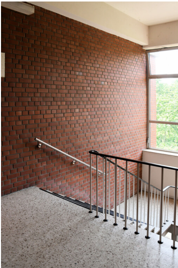
Tagebau Hambach: Betriebsüberwachungsstelle (Gebäude HA 121), Treppenhaus; Foto: 26.06.2023