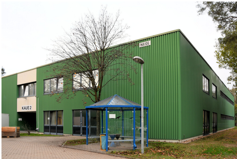
Tagebau Hambach: Neues Sozialgebäude (Kaue 2, Bau HA 106), Ansicht von Osten; Foto: 07.11.2022