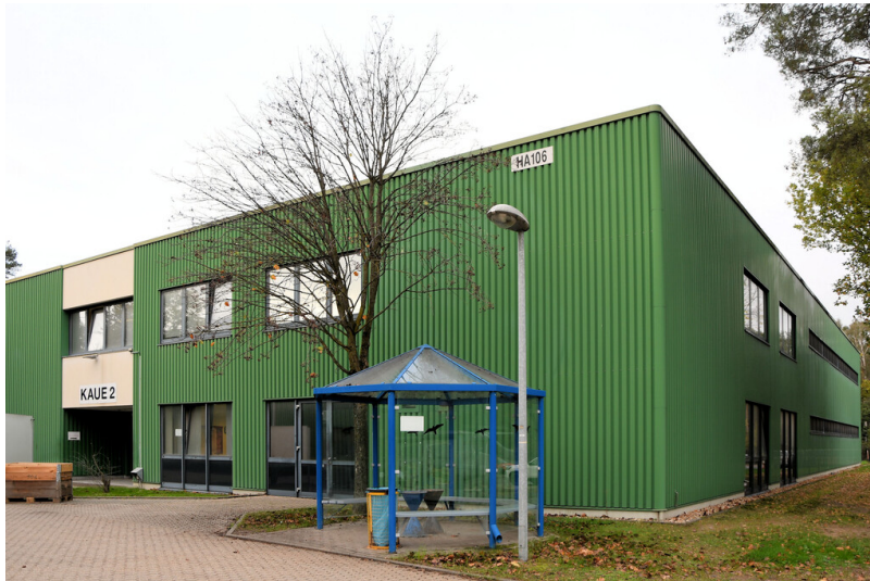
Tagebau Hambach: Neues Sozialgebäude (Kaue 2, Bau HA 106), Ansicht von Osten; Foto: 07.11.2022