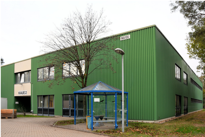
Tagebau Hambach: Neues Sozialgebäude (Kaue 2, Bau HA 106), Ansicht von Osten; Foto: 07.11.2022