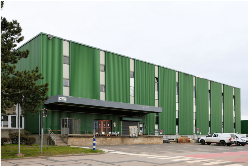
Tagebau Hambach: Magazinegebäude und Büro (Bau HA 127), Ansicht von Nordwesten