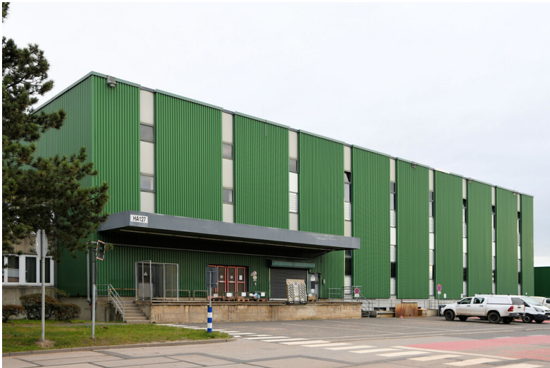
Tagebau Hambach: Magazinegebäude und Büro (Bau HA 127), Ansicht von Nordwesten