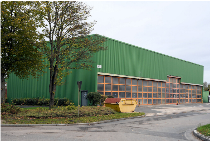
Tagebau Hambach: Kfz-Werkstatt, Ansicht von Südwesten