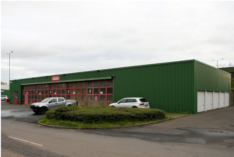
Tagebau Hambach: Feuerwache, Ansicht von Westen; Foto: 07.11.2022