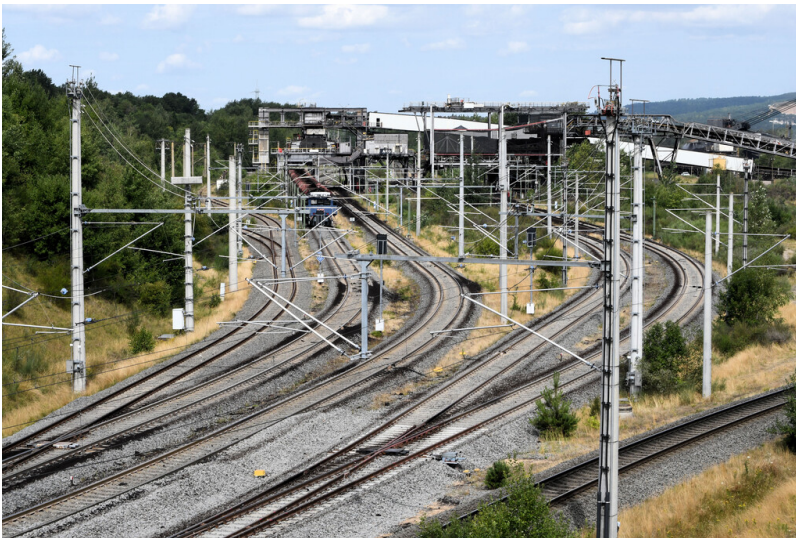
Tagebau Hambach: Anschlussgleise an die Hambachbahn, Ansicht von Südosten; Foto: 14.07.2023