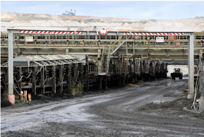
Tagebau Hambach: Fahrstraße unter den Verschiebeköpfen des Bandsammelpunkts, Ansicht von Süden; Foto: 07.11.2022