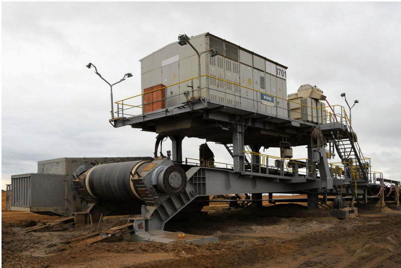
Tagebau Hambach: Bandumkehre B 2800 am Ende von Kippstrosse 7