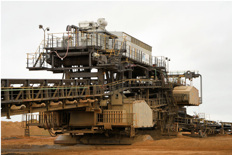
Tagebau Hambach: Bandantriebsstation 2.000 kW auf Kippstrosse 7, Bandauflaufseite