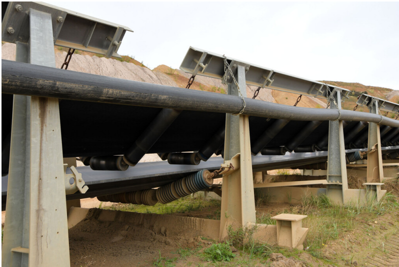
Tagebau Hambach: Bandanlage B 2800 auf Kippenstrosse 7; Foto: 07.11.2022