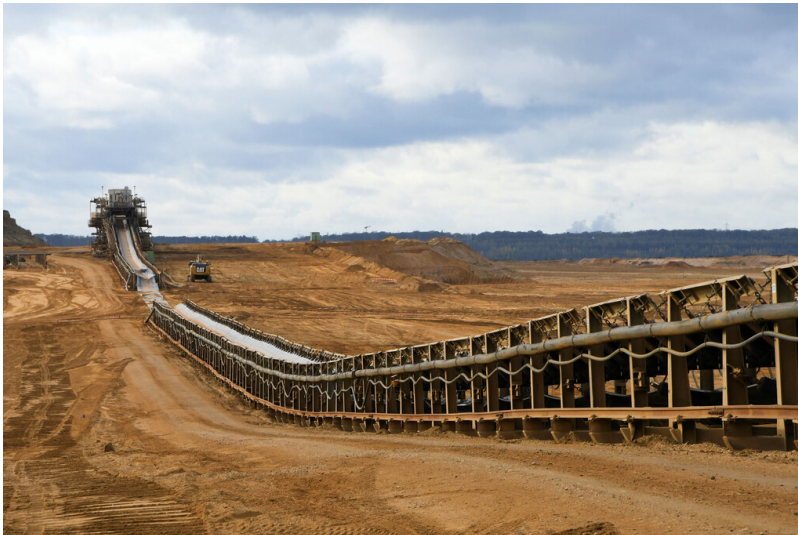
Tagebau Hambach: Bandanlage B 2200 auf der 1. Sohle; Foto: 07.11.2022