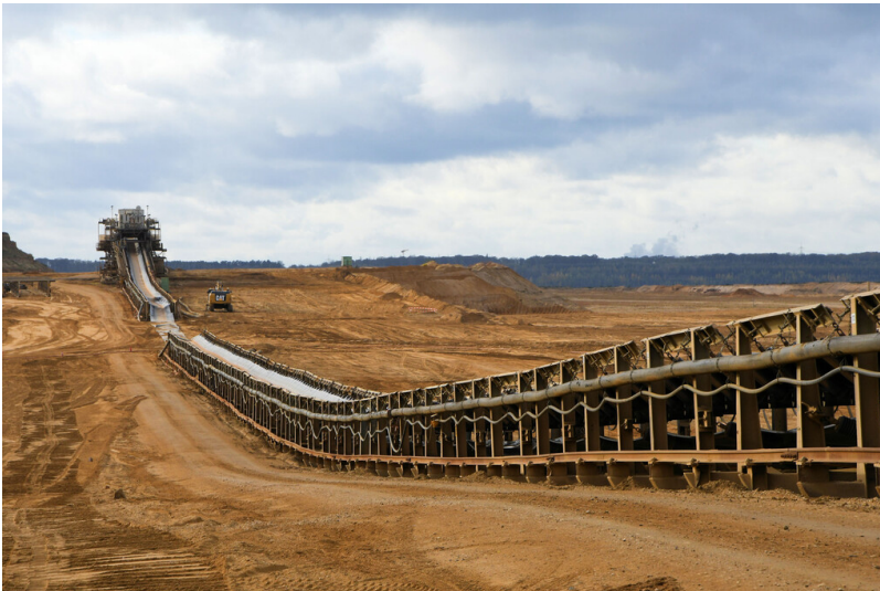
Tagebau Hambach: Bandanlage B 2200 auf der 1. Sohle; Foto: 07.11.2022