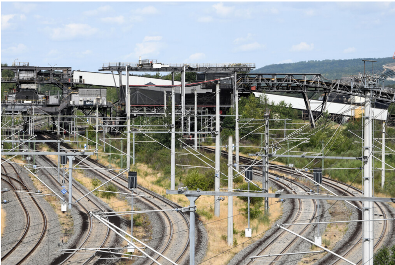
Tagebau Hambach: Zugbeladeanlage L60 mit eingehauster Zuführungsbandbrücke, Ansicht von Südosten (Brücke über die Hambachbahn, Niederzier-Ellen)