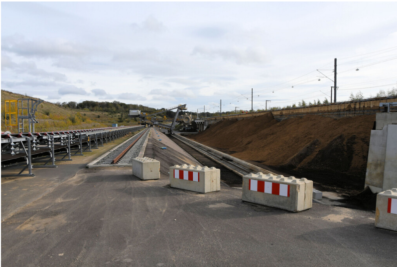
Tagebau Hambach: Lösskipppgraben, Ansicht von Nordwesten; Foto: 07.11.2022