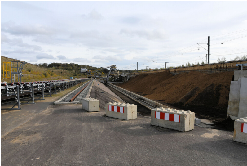
Tagebau Hambach: Lösskippraben, Ansicht von Nordwesten; Foto: 07.11.2022