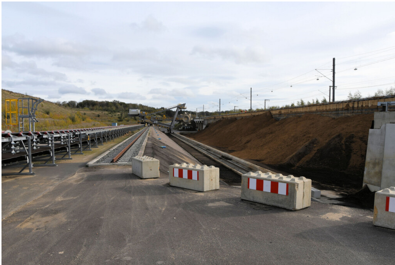
Tagebau Hambach: Lösskippraben, Ansicht von Nordwesten