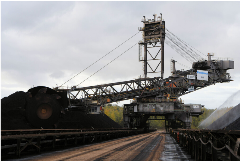
Tagebau Hambach: Schaufelrad-Aufnahmegerät 814 im Kohlebunker Hambach